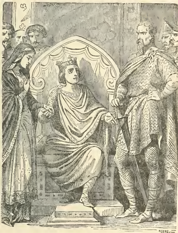
Charles le Simple donne sa fille à Rollon.

Malgré ces menaces poétiques, la sentence fut prononcée, et Rolf, se voyant banni à perpétuité, assembla quelques vaisseaux et cingla vers les Hébrides. Ces îles avaient servi de refuge à une partie des Norvégiens émigrés par suite des conquêtes du roi Harald. Presque tous étaient des gens de haute naissance et d'une grande réputation militaire. Le